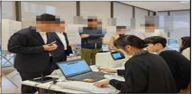
참관인 등 참관