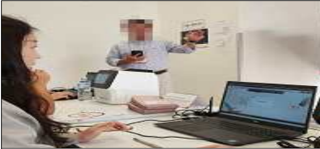
투표 개시 선언 및 시스템 개시