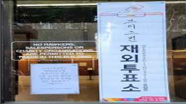
투표소 입구 현판(LF)