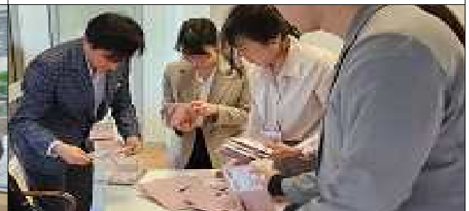
회송용봉투 수 집계