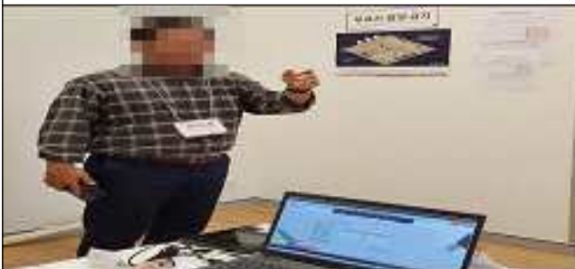
투표마감 선언 및 시스템 마감