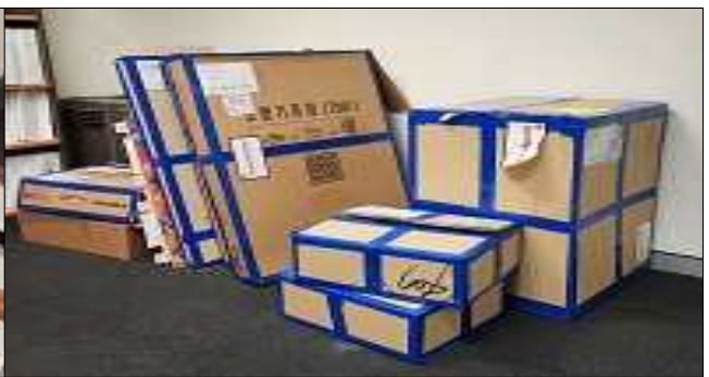
물품·장비 보관상황 지도·점검