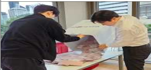
투표함 개함 및 재외투표 정리