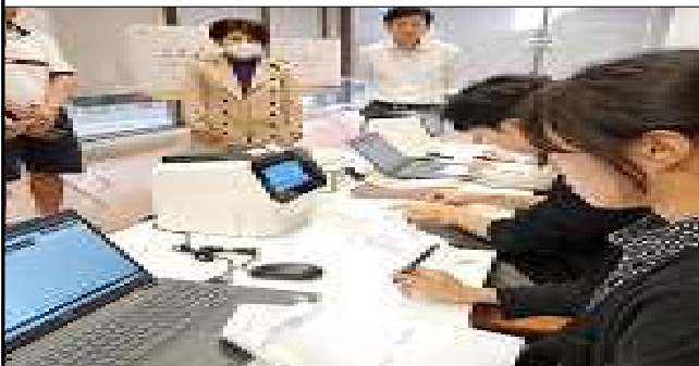
최종 시험 운영