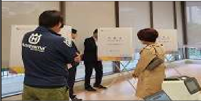
참관인 등에게 투표절차 안내