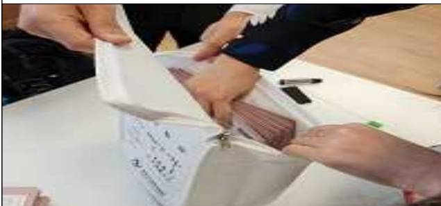
재외투표 보관봉투 투입