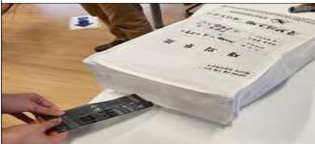
재외투표 보관봉투 봉인