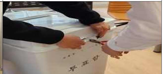
투표함 봉합 해제