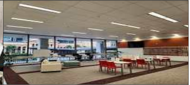
투표진행 중 선거인 대기장소