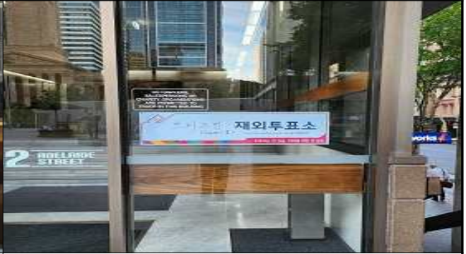
투표소 입구 간판(GF)