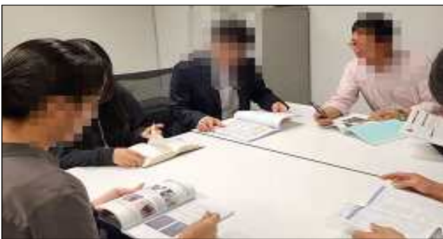
출장소 관계자 회의