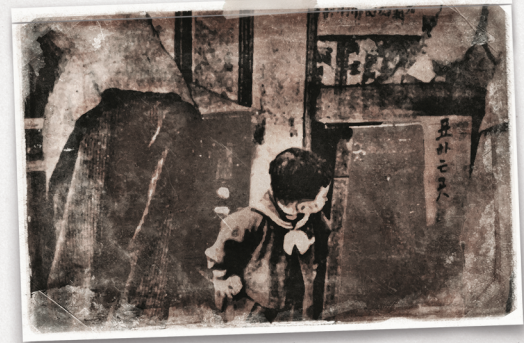
(1948. 5. 10. 제헌국회의원선거 모습)